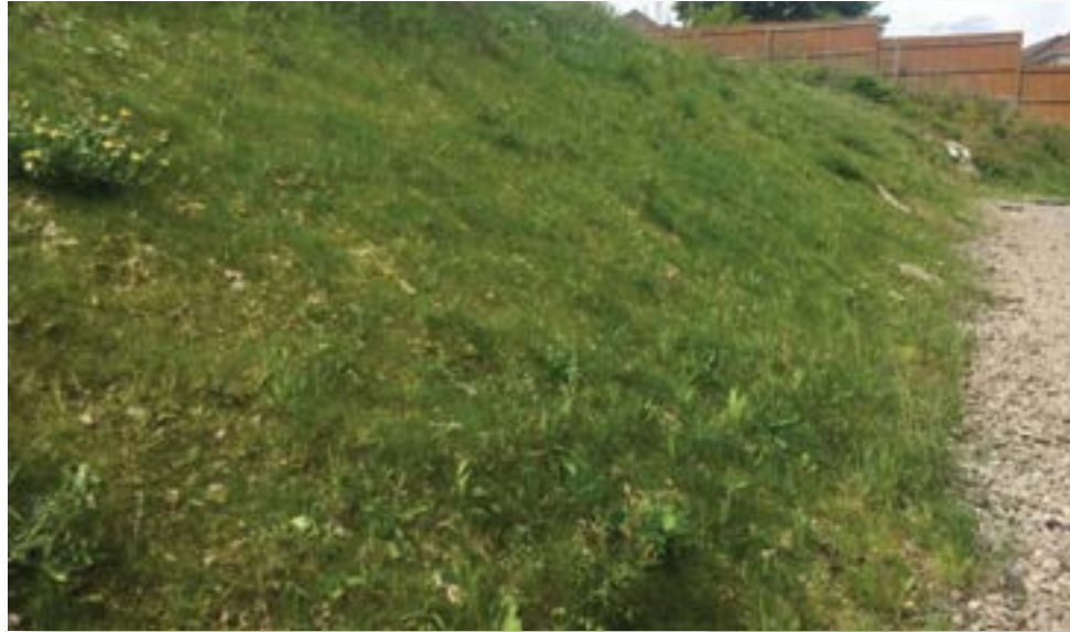
La vegetación se está estableciendo y la erosión se ha evitado con éxito.