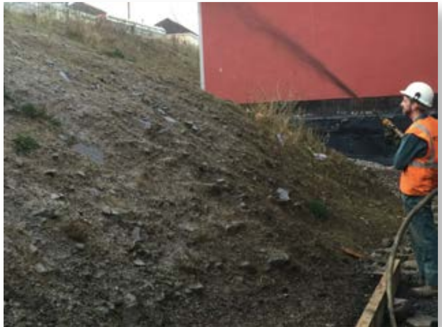
Se aplicó Biotic Earth donde fallaron las operaciones de siembra anteriores.